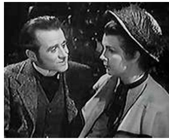
1948 ESTHER WATERS (Esther Waters) d'Ian Dalrymple avec Kathleen Ryan