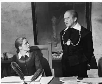
1974 THE ABDICATION d'Anthony Harvey avec Liv Ullmann