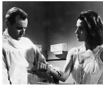
1963 80 000 SUSPECTS (80,000 Suspects) de Val Guest avec Claire Bloom