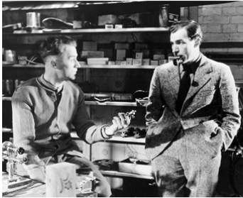
1949 LA MORT APPRIVOISÉE (The Small Back Room) de Michael Powell avec David Farrar