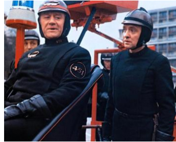
1966 FAHRENHEIT 451 de François Truffaut avec Oskar Werner