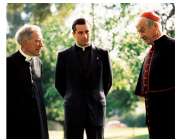
1981 SANGLANTES CONFESSIONS (True Confessions) d'U. Grosbard avec B. Meredith, R. De Niro