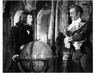
1950 LE CHEVALIER DE LONDRES (The Elusive Pimpernel) de M. Powell avec David Niven