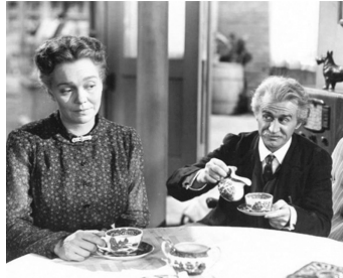
1951 LA FEMME AU VOILE BLEU (The blue Veil) de Curtis Bernhardt avec Jane Wyman