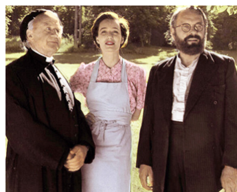
1988 LE DIXIÈME HOMME (The Tenth Man) de Jack Gold avec Kristin Scott-Thomas, A. Hopkins