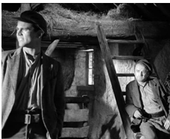
1959 L'ÉPOPEE DANS L'OMBRE (Shake Hands with the Devil) de M. Anderson avec Don Murray