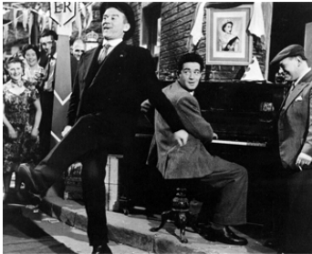
1956 JACQUELINE (Jacqueline) de Roy Ward Baker avec John Gregson