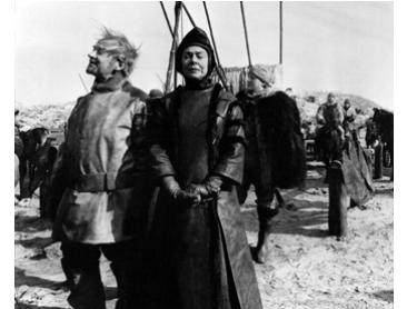
1971 LE ROI LEAR (King Lear) de Peter Brook avec Irene Worth