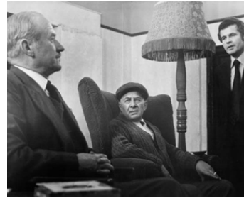
1973 LE RETOUR (The Homecoming) de Peter Hall avec Paul Rogers, Ian Holm