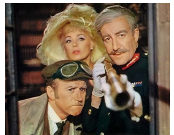
1962 LES FEMMES DU GÉNÉRAL (Waltz of the Toreadors) de J. Guillermin avec D. Robin, P. Sellers