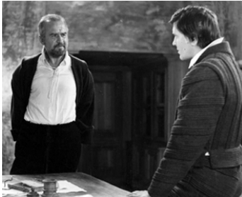
1968 GALILEO (Galileo) de Liliana Cavani avec Lou Castel