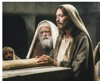
1977 JÉSUS DE NAZARETH (Jesus of Nazareth) de Franco Zeffirelli avec Robert Powell