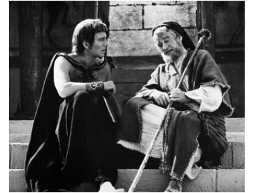
1967 EDIPE ROI (Oedipus the King) de Philip Saville avec Christopher Plummer