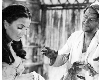
1949 LE LAGON BLEU (The blue Lagoon) de Frank Launder avec Jean Simmons