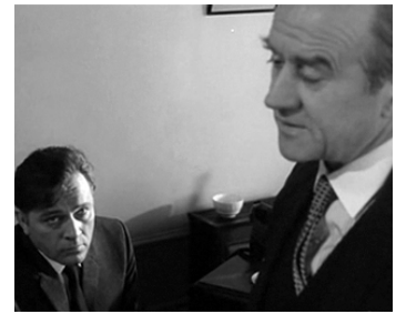
1965 L'ESPION QUI VENAIT DU FROID (The Spy who came from the cold) de M. Ritt avec R. Burton