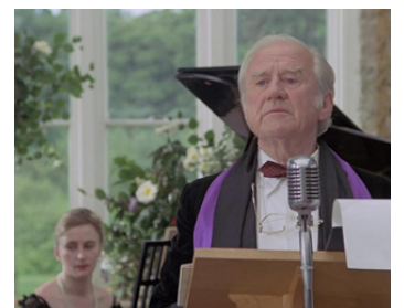
1989 MY LEFT FOOT, L'Histoire de Christy Brown (My Left Foot) de Jim Sheridan