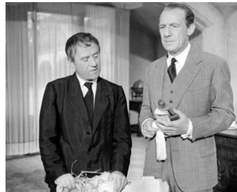
1957 LE JARDINIER ESPAGNOL (The Spanish Gardener) de Philip Leacock avec M. Hordern