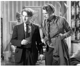
1947 HUIT HEURES DE SURSIS (Odd Man Out) de Carol Reed avec Dan O'Herlihy