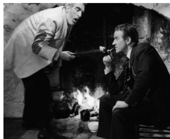
1957 QUAND SE LÈVE LA LUNE (The Rising of the Moon) de John Ford avec Noel Purcell