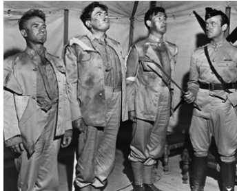
1951 TROIS TROUPIERS (Soldiers Three) de Tay Garnett avec S. Granger, R. Newton, D. Niven