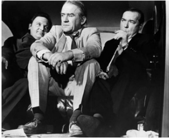
1966 PASSEPORT POUR L'OUBLI (Where the Spies are) de Val Guest avec George Pravda