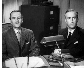
1949 ALL OVER THE TOWN de Derek Twist avec Walter Horsburgh