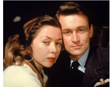
1956 L'HOMME QUI N'A JAMAIS EXISTÉ (The Man who never was) de R. Neame avec Gloria Grahame