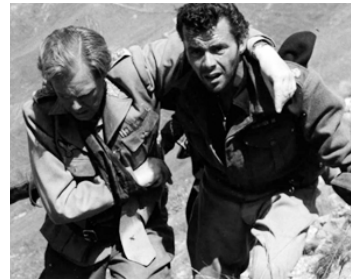
1957 I'LL MET BY MOONLIGHT de Michael Powell & E. Pressburger avec Dirk Bogarde