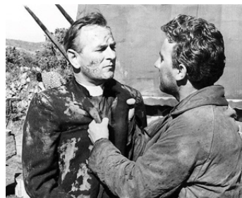
1961 JOHNNY NOBODY de Nigel Patrick avec Nigel Patrick