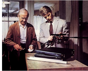
1973 CHACAL (The Day of the Jackal) de Fred Zinnemann avec James Fox