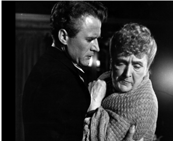
1950 LA RENARDE (Gone to Earth) de M. Powell & E. Pressburger avec Sybil Thorndike