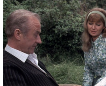
1970 TAM LIN (The Ballad of Tam Lin) de Roddy McDowall avec Stephanie Beacham