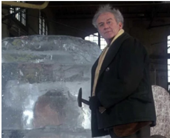
1971 HAROLD ET MAUDE (Harold and Maude) d'Hal Ashby