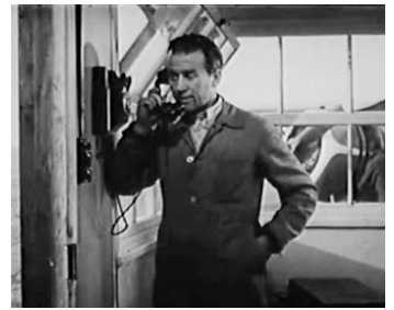
1948 L'ÉVADÉ DE DARTMOOR (Escape) de Joseph L. Mankiewicz