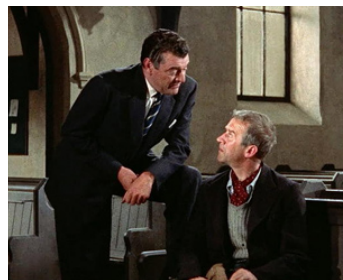
1958 INSPECTEUR DE SERVICE (Gideon's Day) de John Ford avec Jack Hawkins