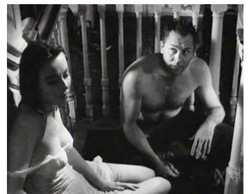
1958 FROID DANS LE DOS (Floods of Fear) de Charles Crichton avec Anne Heywood