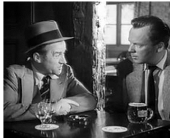
1956 THE MAN IN THE ROAD de Lance Comfort avec Derek Farr