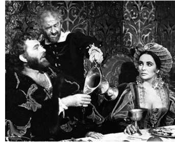
1967 LA MÉGÈRE APPRIVOISÉE (The Taming of the Shrew) de F. Zeffirelli avec R. Burton, E. Taylor