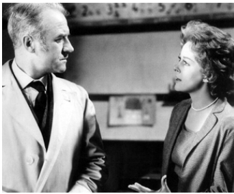
1962 CHOC EN RETOUR (I Thank a Fool) de Robert Stevens avec Susan Hayward