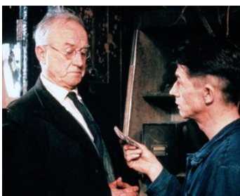
1984 1984 (Nineteen Eighty-Four) de Michael Radford avec John Hurt