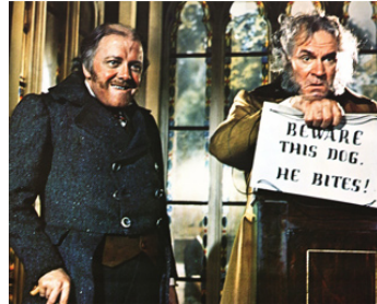
1969 DAVID COPPERFIELD de Delbert Mann avec Richard Attenborough