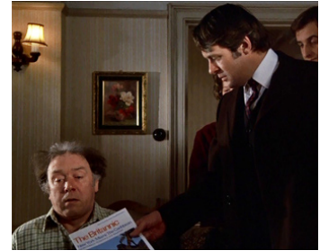
1974 TERREUR SUR LE BRITANNIC (Juggernaut) de Richard Lester avec Anthony Hopkins