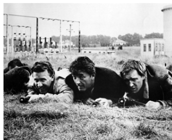
1960 LES COMBATTANTS DE LA NUIT (A Terrible Beauty) de T. Garnett avec R. Mitchum, R. Harris